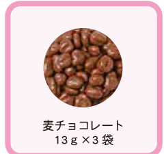
麦チョコレート 13g × 3袋